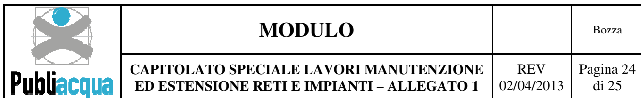
Tabella di sintesi